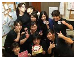
アロマサロン箱根強羅店 BDの事業部長祝い