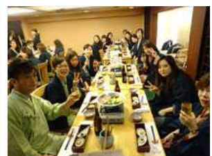
期首会議で懇親会を実施!