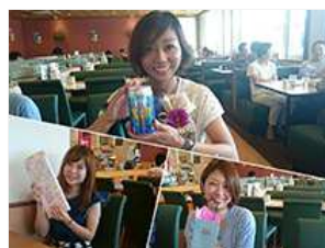
コミュニケーションは大切! MGRからのブ レゼントに喜ぶセラピストっ